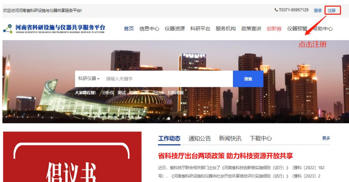
图 1 注册入口

企业单位或者个人登录省共享平台（www.hniss.cn）在右上角点击注册，进入政务网注册页面，根据实际情况完成“个人注册”或“法人注册”。（注：此环节注册的是政务网账号）