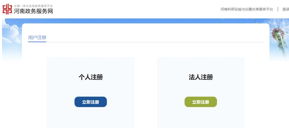
图 2 注册界面