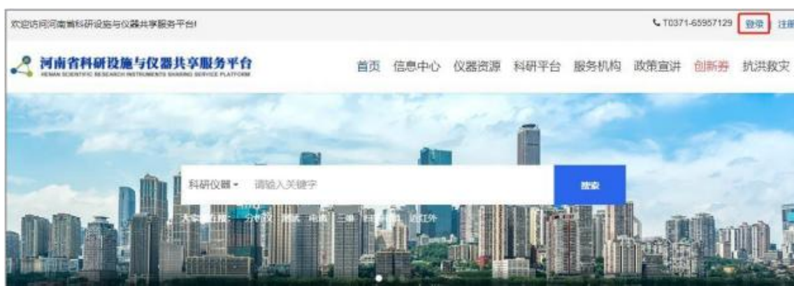
图 3 登陆入口