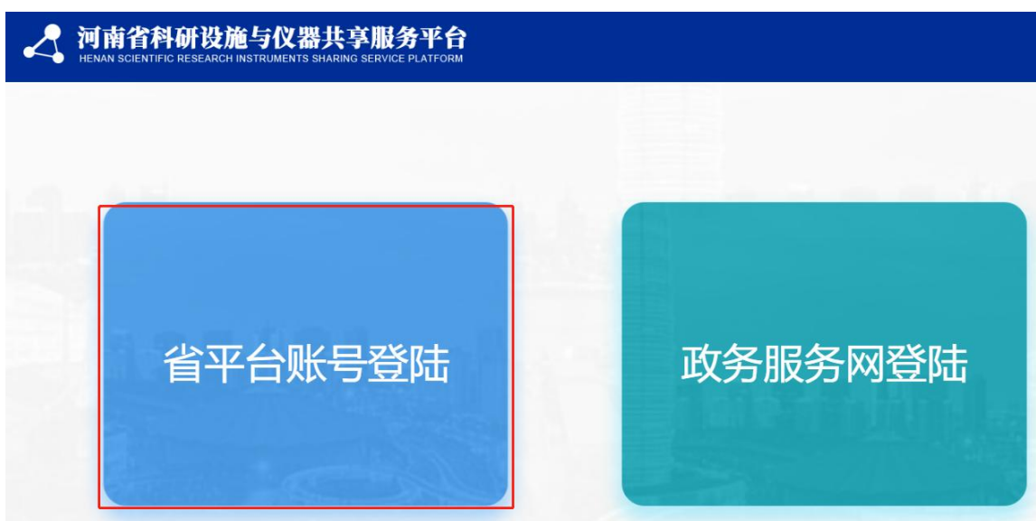
图1 已有省平台账号登录选项

如果有省平台账号，可直接登录。（按照河南省人民政府要求，实现政务服务“一网通办”，2018年省共享服务平台网站响应政府文件，进行了升级改造，因此，在18年之前通过省共享服务平台注册的账号可直接登录，同时，管理单位可根据实际情况选择是否与政务网账号绑定）。